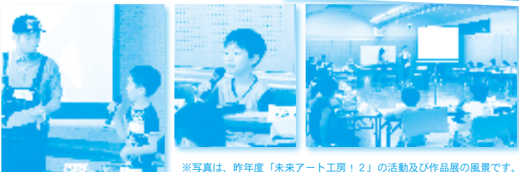
※写真は、昨年度「未来アート工房！2」の活動及び作品展の風景です。